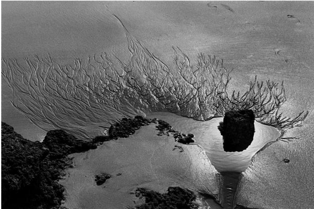
Lucien Clergue©, Langage des sables, Camargue , 1976.