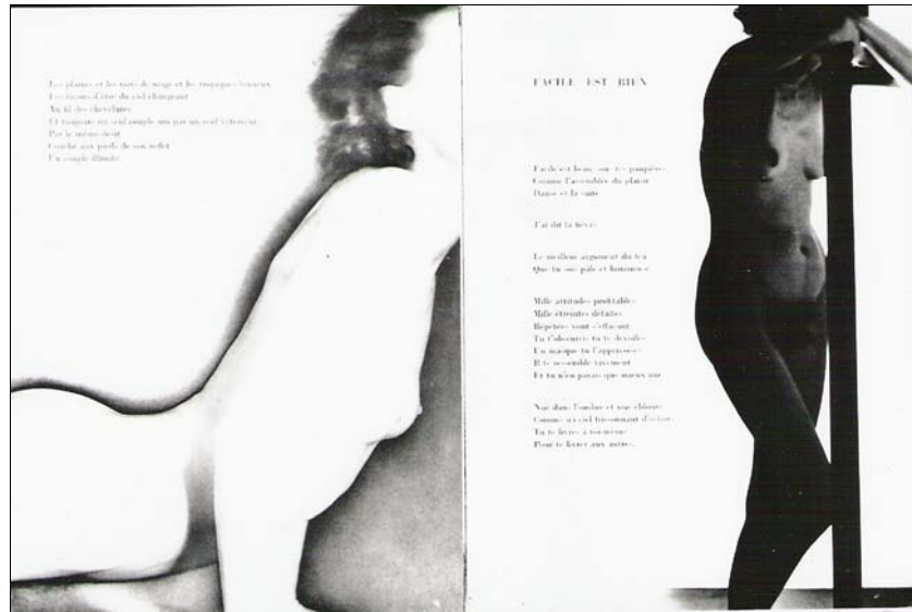
Paul Éluard – Man Ray : FACILE Sixième double page Saint-Denis – Musée d'art et d'histoire Inv. 94 07 40 et 94 07 117

Les plaines et les toits de neige et les tropiques luxueux Les façons d'être du ciel changeant Au fil des chevelures Et toujours un seul couple uni par un seul vêtement Par le même désir Couché aux pieds de son reflet Un couple illimité.