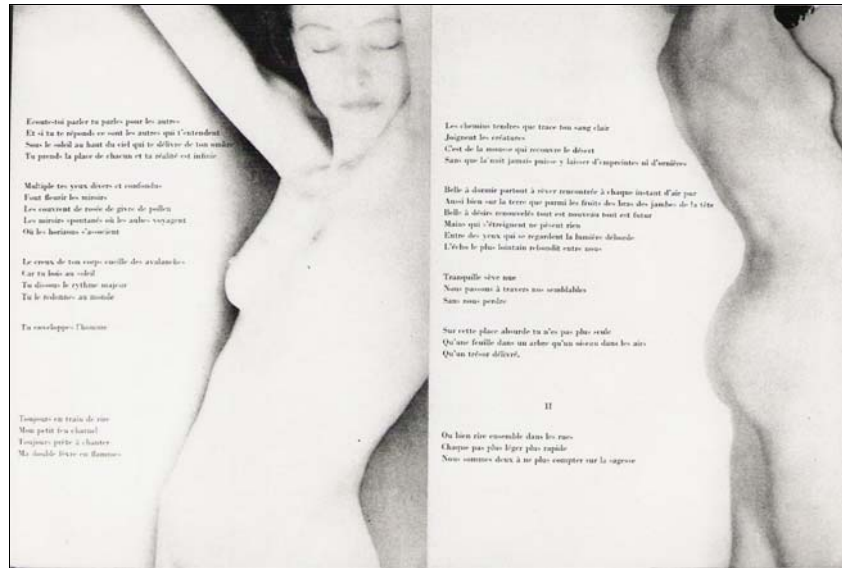
Paul Éluard – Man Ray : FACILE Troisième double page Saint-Denis – Musée d'art et d'histoire Inv. 94 07 40 et 94 07 117

Écoute-toi parler tu parles pour les autres Et si tu te réponds ce sont les autres qui t'entendent Sous le soleil au haut du ciel qui te délivre de ton ombre Tu prends la place de chacun et ta réalité est infinie