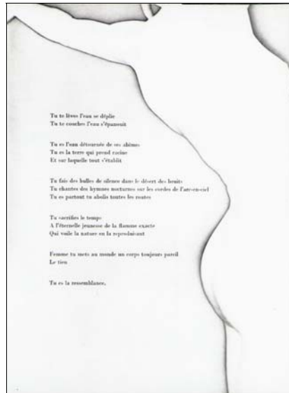
Paul Éluard – Man Ray : FACILE Première double page Saint-Denis – Musée d'art et d'histoire Inv. 94 07 40 et 94 07 117

Tu te lèves l'eau se déplie Tu te couches l'eau s'épanouit