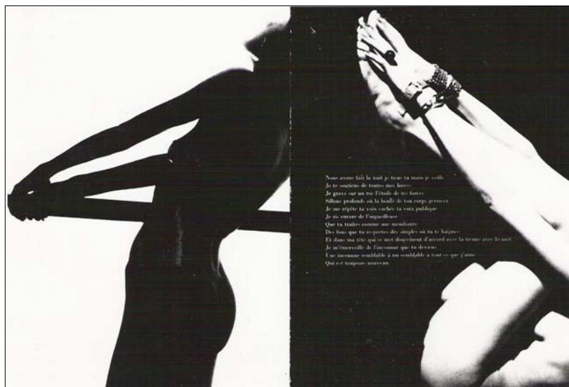
Paul Éluard – Man Ray : FACILE Septième double page Inv. 94 07 40 et 94 07 117

Nous avons fait la nuit je tiens ta main je veille Je te soutiens de toutes mes forces Je grave sur un roc l'étoile de tes forces Sillons profonds où la bonté de ton corps germera Je me répète ta voix cachée ta voix publique Je ris encore de l'orgueilleuse Que tu traites comme une mendicante Des fous que tu respectes des simples où tu te baignes Et dans ma tête qui se met doucement d'accord avec la tienne avec la nuit Je m'émerveille de l'inconnue que tu deviens Une inconnue semblable à toi semblable à tout ce que j'aime Qui est toujours nouveau.