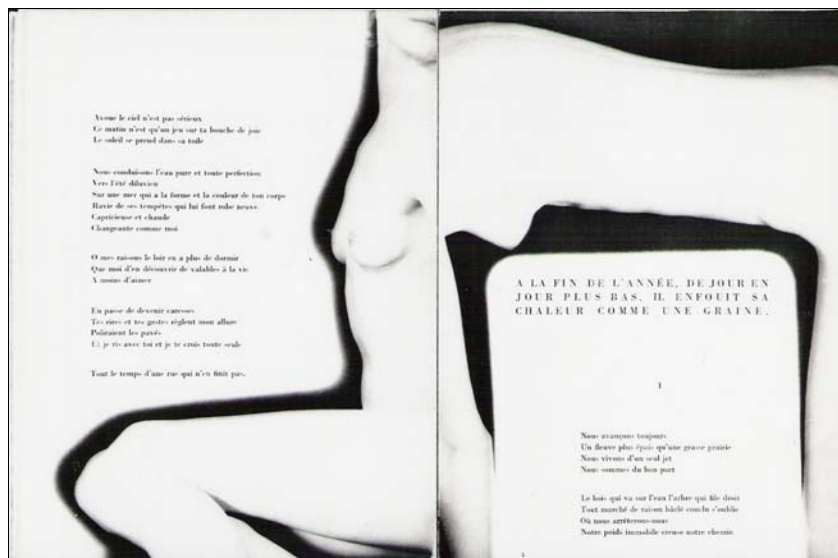
Paul Éluard – Man Ray : FACILE Quatrième double page Saint-Denis – Musée d'art et d'histoire Inv. 94 07 40 et 94 07 117

Avoue le ciel n'est pas sérieux Ce matin n'est qu'un jeu sur ta bouche de joie Le soleil se prend dans sa toile